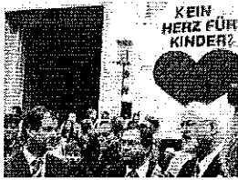
Ministerpräsident Carstensen verteidigte den Sparkurs der Regierung vor dem Kieler Landeshaus.

Hitzige Debatte im Landtag in Kiel: SPD, Grüne, SSW und Linke haben der schwarz-gelben Regierung in einer von Zwischenrufen geprägten Aktuellen Stunde am Mittwoch vorgeworfen, den Haushalt auf Kosten der Kinder sanieren zu wollen. Die Koalitionsfraktionen verteidigten ihre Pläne als notwendig. In der kommenden Woche werden CDU und FDP wahrscheinlich beschließen, die gerade erst eingeführte Beitragsfreiheit für das letzte Kindergartenjahr wieder abzuschaffen. Carstensen hatte dies am Morgen angedeutet, als er zu etwa 800 Eltern, Kindern und Erziehern sprach, die vor dem Landeshaus gegen die Sparpläne der Regierung protestierten. "Wir haben formal noch keinen Beschluss. Aber rechnen Sie damit. Wir können uns das nicht leisten", sagte der Regierungschef. Mit der Abschaffung des beitragsfreien Jahres würde das Land rund 35 Millionen Euro im Jahr einsparen.