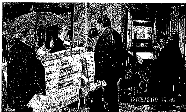
Eltern und Erzieher mit Minister Klug in Ratzeburg

Liebe Mitstreiter, die Reporterkamera klickte und Minister Klug staunte: Trotz schlechtem Wetter haben ihm Eltern und Erzieher in Ratzeburg die Forderungen des Aktionsbündnisses vorgehalten. Mit solchen und ähnlichen Aktionen wird unser Thema weiter hochgezogen: Kürzt den Kindern nicht die Zukunft! Uns reicht's!